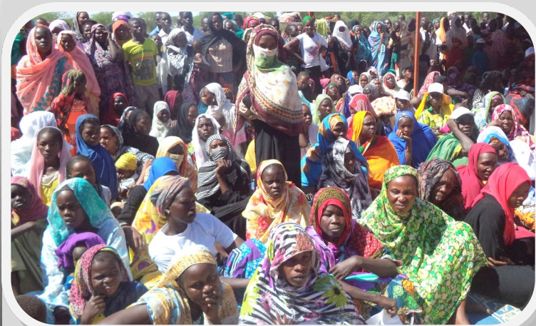
Vue partielle constituée des jeunes filles et femmes sorties massivement pour la vaccination